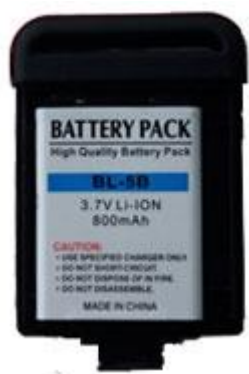
Установка аккумуляторной батареи