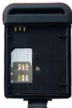
Место для установки SIM-карты (под батареей)